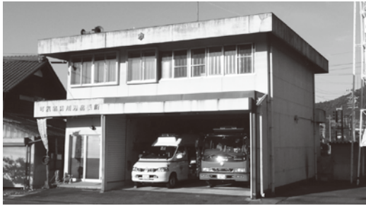
（可茂消防川辺出張所）

現在の川辺出張所敷地面積は468・81㎡で、このうち川辺町が243・81㎡を現在建設中の出張所用地の一部と交換し所有しており、残りの225㎡は東海旅客鉄道株式会社（JR東海）か