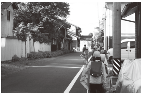
(下麻生地内 通学路)

近隣の自治体では、地域住民と行政が一体となり、廃屋化した建物の所有者と面談し、建物の現状と周辺に与えている影響等を説明し、適切な管理をするよう粘り強く求めた結果、解決した事例もあることから、今後もしも粘り強く交渉してまいります。