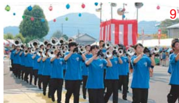
1・2. 激しい踊りで会場を沸かす鳴子踊り「夢翠」と川辺スポーツクラブ「ジュニアHipHop」 3. 公民館ホールで演奏する高校生バンド 4. ボランティアの中部学院大学の皆さん 5. 湖岸線も多くの来場者で賑わいました 6. 浴衣姿の女性が輪を作ります 7. 子どもたちのヒーロー「ボートン戦隊カワベンジャヤー」 8・9. オープニングを飾った美濃加茂高校プラスバンド部 10. 大スターメインが打ち上がると大きな歓声が上がりました