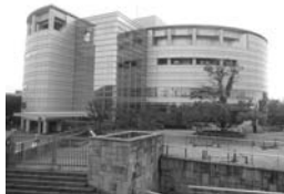
ぎふ清流文化プラザ外観

県民文化ホール未来会館が、「ぎふ清流文化プラザ」として生まれ変わります。この新たな文化施設では、県民誰もが主役となって、多様な文化事業が展開されます。皆様のお越しをお待ちしております。