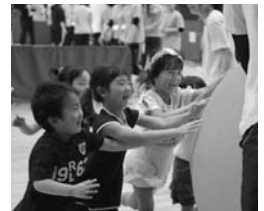
レクリエーションフェスティバル(H27.5月)の様子

来年9月、「第70回全国レクリエーション大会in岐阜」が岐阜県で初めて開催されます。その1年前となるこの時期に、レクリエーションフェスティバルを県内各圏域で開催します。各種目の体験コーナーは、子どもからお年寄りまで気軽に参加できます。