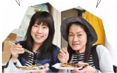
岐阜市・垂井町から来店