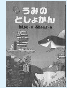
うみのとしょかん 著：葦原かも 絵：森田みちよ