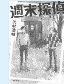
週末探偵 著：沢村浩輔