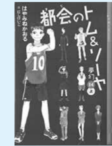
都会のトム&ソーヤ(夢幻)④上巻 著：はやみねかおる 絵：にしけいこ