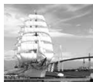
新湊漁港周辺 (新湊大橋と帆船海王丸)

7月5日の「富山・岐阜交流の日」にちなみ、富山県の魅力に触れる日帰りバスツアーを行います。今年は富山市ガラス美術館や射水市の新湊漁港を訪れます。