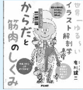
世界一ゆるいイラスト解剖学 からだと筋肉のしくみ 著・絵：有川譲二

また、リクエスト本を常時受け付けておりますので、図書室に入れてほしい本などがあれば、お気軽にリクエストしてください。お待ちしております。