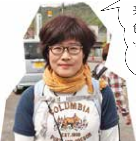
美濃加茂市から来店