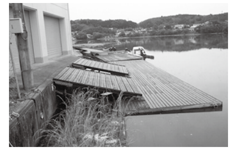
普段は川面に浮く棧橋が、水位低下のため河床に着いています。