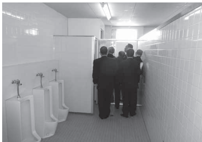
改修を予定している各小学校トイレの現地確認(写真は西小学校)