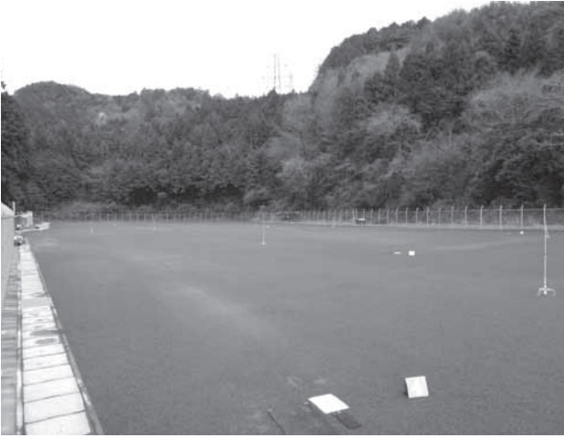
石神グラウンドゴルフ場

今後のグラウンド整備には、グラウンドゴルフ場も含め更に検討を進めたいと考えています。