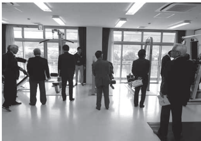
購入したトレーニング機器の現地確認

総務委員会では、委員会審査の最終日に、委員会で選定した場所を視察しました。各施設では、担当課から説明を受けながら、現況を確認しました。