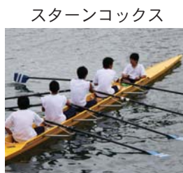
スターンコックス

両者にはそれぞれ利点があり、スターンコックスは常に漕手も見ているので、フォームやタイミングなどを指導することができます。⇨中学や高校などでは主にこのボートを使っています。