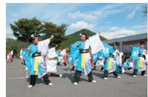
晴れやかな鳴子踊り