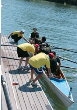
各部署でボランティアの方々を支えてくれました↑