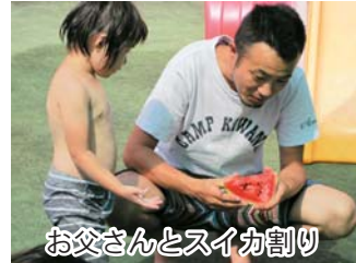
お父さんとスイカ割り