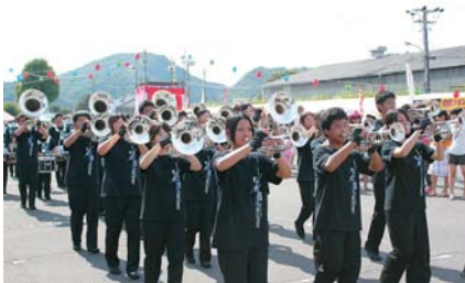
美濃加茂高校の見事なマーチングバンド