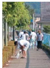
翌朝に町内各地でごみ拾いをしてくださいました。