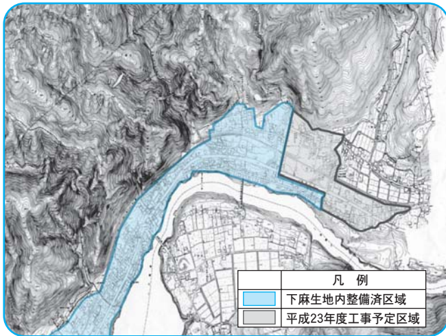
平成23年度公共下水道関連工事箇所図