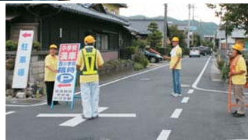
花火大会を陰で支えてくださった交通安全協会の方々