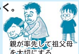
親が率先して祖父母を大切にする

大人たちは、自らの親への接し方や、思いやりのある社会のために何が必要かについて、子ども自身から問われているのだということを考えましょう。