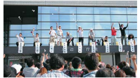
景品付き「もち投げ」も大好評