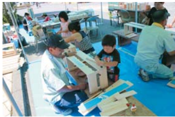
うまくできたかな？好評だった木工教室