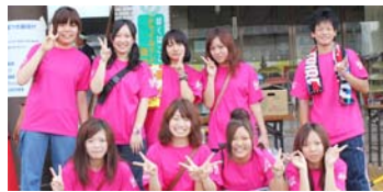
中部学院大学のボランティアサークルなどのメンバーがゴミの分別等スタッフとしてお手伝いしてくれました。