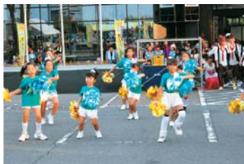
鮮やかなコスチュームで会場は華やかに