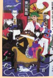
謎解きはディナーのあとで