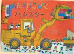
おたすけこびととハムスター