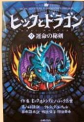
ヒックとドラゴン