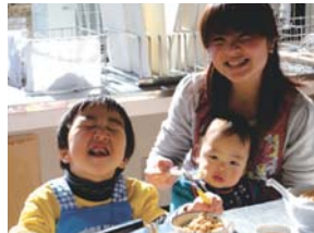
キッズビビンバ おいしーい!