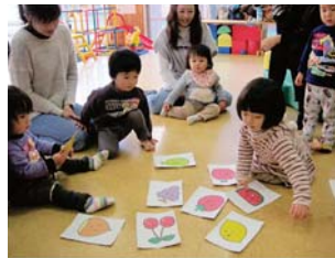
みんなで かるたとりしたよ