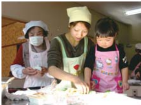
私にもできるよ お手伝い