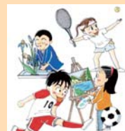
子どもの夢や希望に 耳を傾け励ます