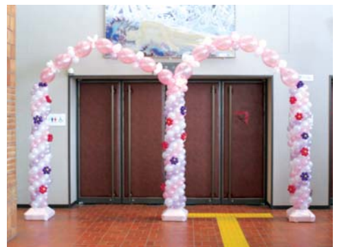
川辺町ジュニアリーダーズクラブの手作りによる風船のアーチで会場は華やかに