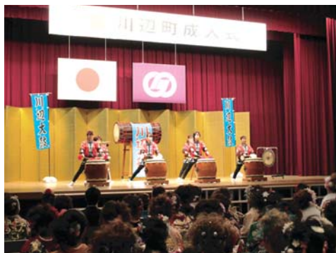
川辺太鼓によるオープニング