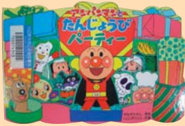
アンパンマンと たんじょうび パーティー