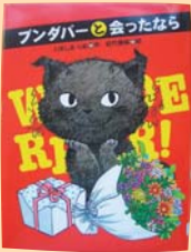
フンダバーと 会ったなら