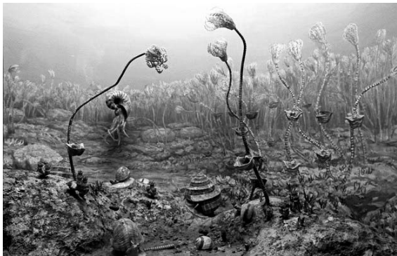
【古生代終わり頃の海】

県内では、恐竜がいた頃よりも古い時代の化石が多く見つかっています。太古の生物の繁栄と大量絶滅。その歩みの記憶を化石や復元画を通してたどります。