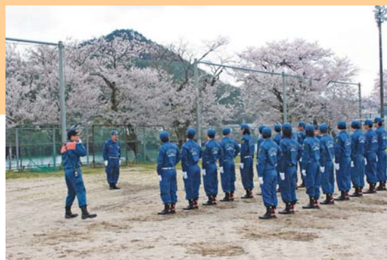
基礎訓練を受ける新入団員

平成26年度川辺町消防団入退団式が4月6日(日)、川辺中学校グラウンドで行われました。今年度は入団者20名、退団者20名で総勢174名の消防団員で川辺町の防災にあたっていきます。