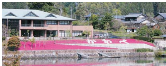
やすらぎの家の前には「かわべ」の文字がくっきり

湖岸遊歩道に沿って、芝桜が鮮やかです。芝桜は4月上旬から5月上旬までが見ごろで、川辺町では桜が散っても芝桜が気分を高めてくれます。