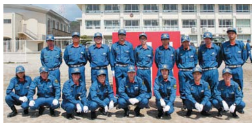
入団された皆さん