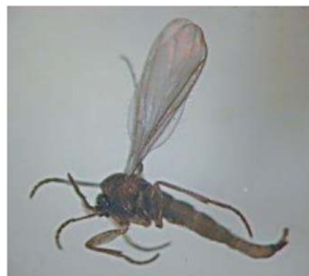
クロバネキノコバエ（拡大）