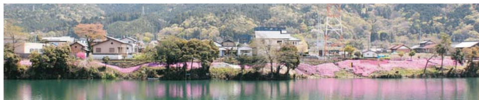
湖面に反射した芝桜がボート競技選手や遊歩道散策の方を楽しませてくれます