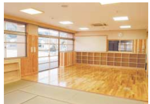
児童館の放課後児童クラブ室