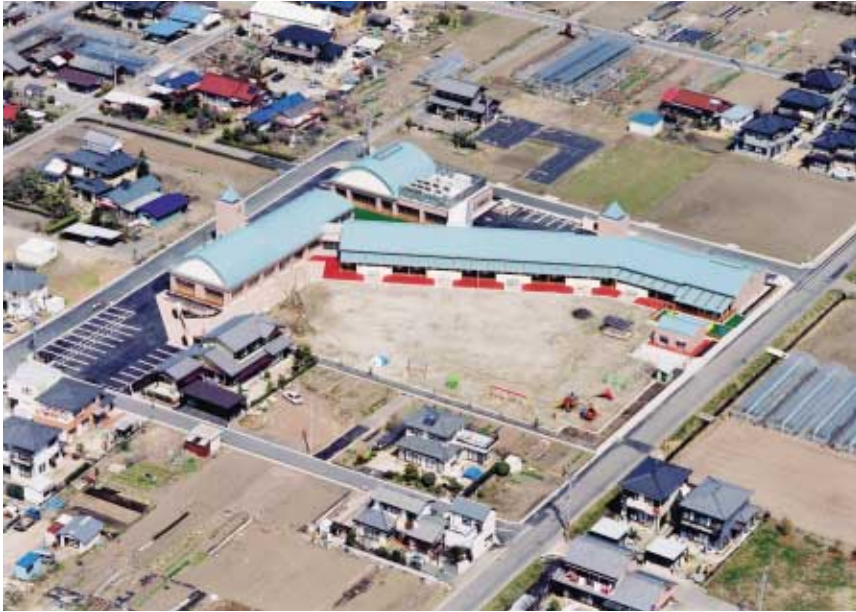
上空から見た第三保育所・児童館