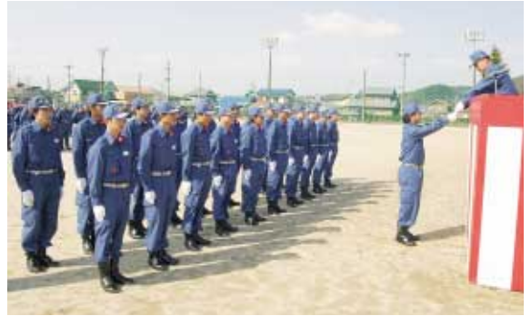
新入団員 2名の辞令交付式

平成15年度川辺町消防団入退団式が4月6日(日)、川辺中学校グラウンドで行われました。本年度は入団者22名、退団者30名となり総勢179名の消防団員で川辺町の防災にあたつていきます。