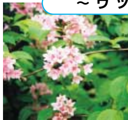
タニウツギ (谷空木)