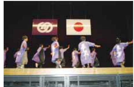
(夢翠のオープニング)

また、「地域の活動発表」では、上川辺区、中川辺区、下吉田区の青少年育成地区推進員の方が地区ふれあい集会などについて発表されたあと、川辺町ジュニアリーダーズクラブの発表がありました。