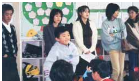
昨年度のあらたまの日から

1日中、各小・中学校を開放していますので、どの時間帯でも結構です。どなたもお気軽に学校へお出かけください。