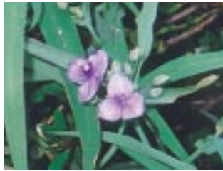
ムラサキツククサ