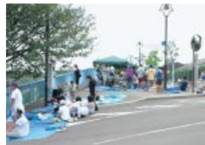
ダム湖畔は人でいっぱい