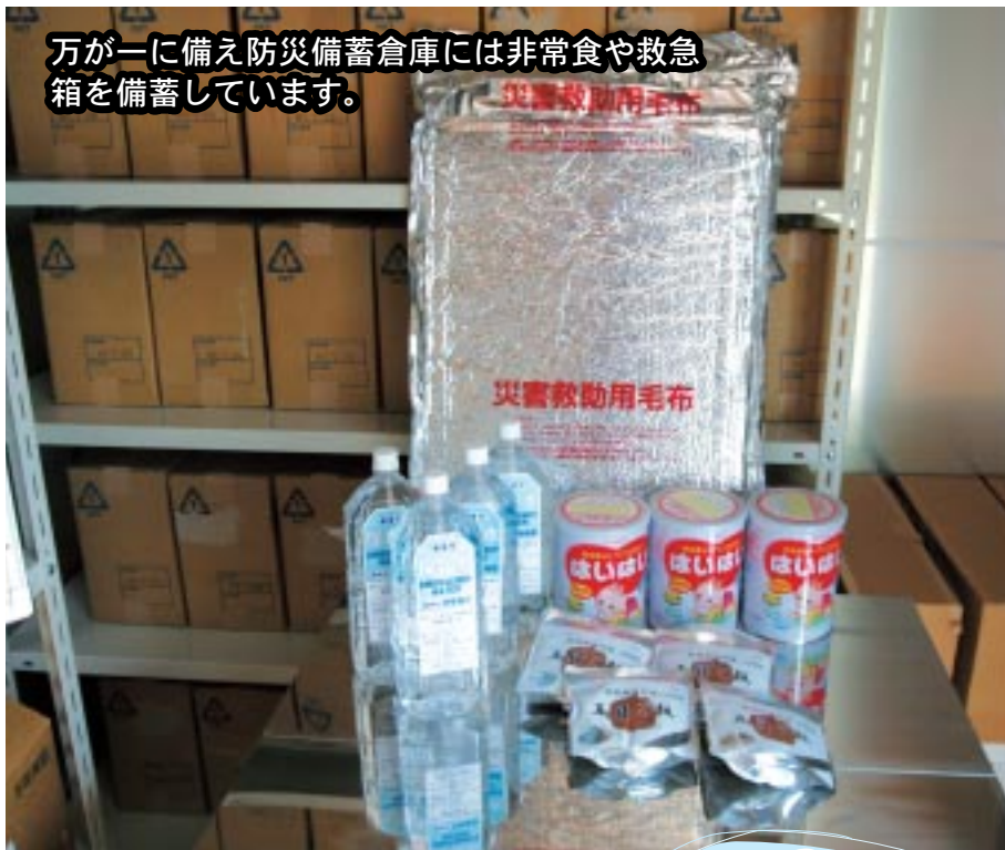
万が一に備え防災備蓄倉庫には非常食や救急箱を備蓄しています。

幸いにも川辺町では近年、地震や水害など大規模な災害は発生していません。だからといって、安全で何事も無い日々を当たり前のように感じてはいませんか。油断や慢心を見透かしたように災害は突然私たちの身に降りかかってくる可能性があります。実際に大きな災害が発生し建物の倒壊や火災、道路の損壊などが多発したとき、役場や消防をはじめとする公的防災機関だけでは十分な対応ができないことが考えられます。 「いざ」というときに備えて、家庭はもちろん地域ぐるみでふだんから防災に対する正しい知識を身につけ、「自分の身は自分で守る」の精神で、危険箇所の確認や避難場所・避難経路について話し合っておくことが必要です。