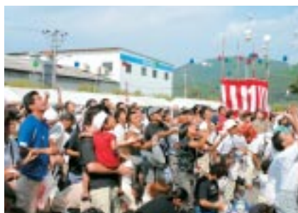
景品付きもち投げ大会