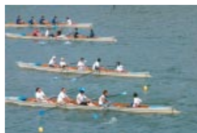
みんなで力いっぱい漕いでます