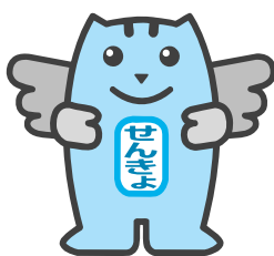
みんなの一票大切に！