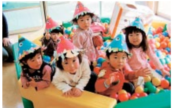
「おにの帽子を作って、みんなで豆まき遊びをしたよ☆」