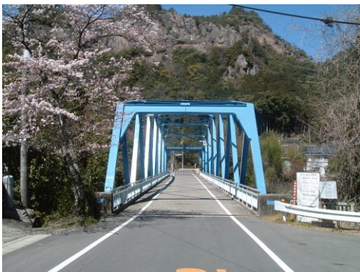
飛騨川橋 (下吉田・下麻生) 昭和 41 年架設 (平成 22 年度修繕) 橋長 L=67m