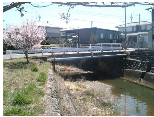
福島橋 (福島) 昭和 41 年架設 (平成 26 年度修繕) 橋長 L=12m