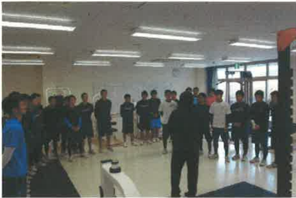
○平成29年3月10日・美濃加茂高校、八百津高校ボート部