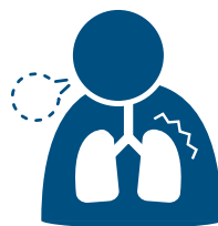
Dificuldade de respirar

Como há diferenças individuais nos sintomas, entre em contato imediatamente se achar que o sintoma é grave.