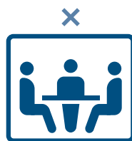
Evitar locais fechados

Evite os Três Mitsu/密 (ambientes sem ventilação "Mippei", locais com aglomeração "Misshu", contato muito próximo entre pessoas "Missetsu") e procure usar o aplicativo COVID-19 Contact-Confirming Application (Aplicativo de confirmação de contato-COCOA) que permite saber se você teve contato com uma pessoa infectada.