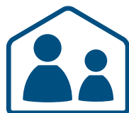
Evitar sair de casa

Se estiver com febre ou outros sintomas de gripe ou resfriado, evite sair de casa e não vá para a escola ou trabalho; procure diariamente medir e registrar a temperatura corporal.