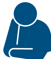
Cansaço ou apatia