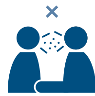
Evitar contatos muito próximos