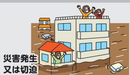
災害発生 又は切迫