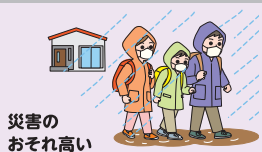
災害の おそれ高い