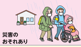
災害の おそれあり