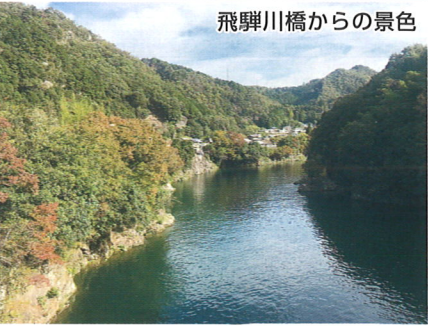
飛騨川橋からの景色