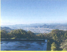
権現テラス第二展望台